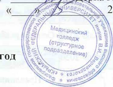
График учебных и производственных практик 2019-2020 учебный год Осенний семестр 2019г